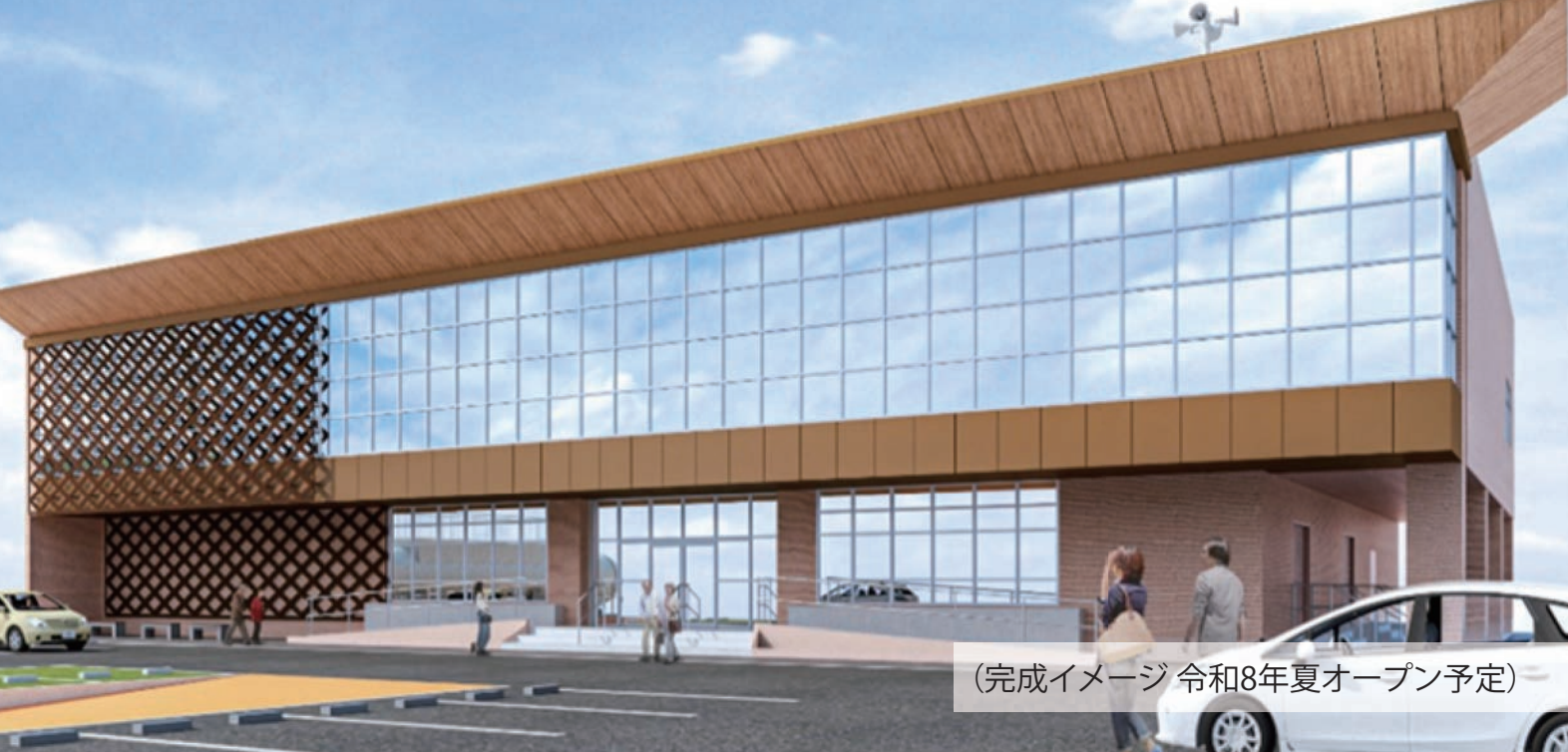
(完成イメージ 令和8年夏オープン予定)