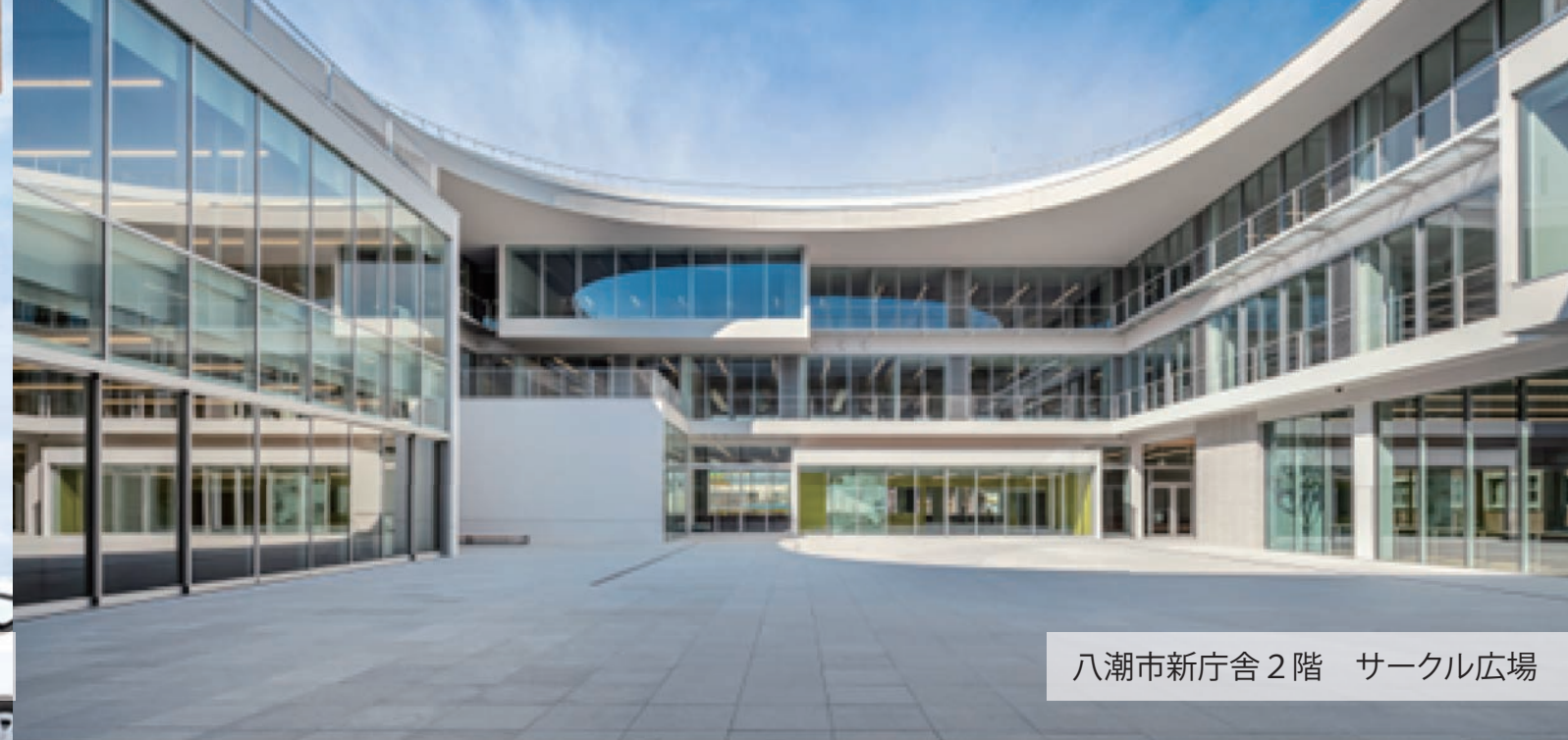
八潮市新庁舎 2階 サークル広場