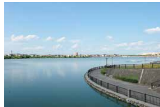
レイクタウン（大相模調整池）

越谷市は埼玉県の南東部に位置し、東京都心まで25キロ圏内の都市です。市内の鉄道は南北に東武スカイツリーライン、東西にJR武蔵野線が通り、あわせて8つの駅が設置されています。また国道4号（草加バイパス）が市内のほぼ中央を縦断し、市民や市内事業者の交通の軸となっており、国道463号とも繋がっているほか、市東部のレイクタウンエリアを南北に走る国道4号（東埼玉道路）は、東京外かく環状道路と並行する国道298号に接続しています。首都高速道路、外環道、東北自動車道なども近く、通勤や物流面において、交通アクセスに優れたまちです。