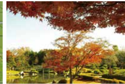
秋の日本庭園「花田苑」