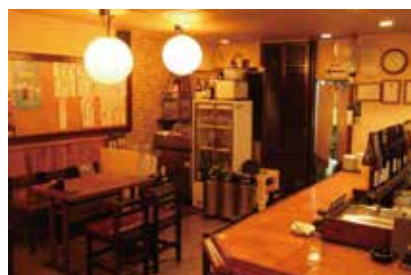
落ち着いた店内で贅沢な食事を

最初に出てくるお通しの茶わん蒸しは出汁の味が旬の食材を活かして品がありとても美味しいです。天ぷら・お刺身・魚の煮つけなども旬のものが食べれます。また、私のようなお酒を飲めない方にも素材を活かしたピザや魚介の丼ぶりなどの一品料理もあるのでお店に通いやすいです。落ち着いてお酒や料理を楽しみたい方におすすめのお店です。【住所】草加市栄町3丁目1-4 【TEL】048-933-4567 【営業時間】17:00～24:00 (LO23:20) 【定休日】日曜日