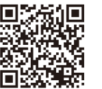
埼玉東支部専用 メール登録フォームへ

まだ登録をされていない方や、メールアドレスが変わった方、新しくメールアドレスを取得した方など、是非右のQRコードからお申し込みください。ホームページでも受付しています。