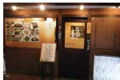
駅前通りの隠れた名店

私が今回ご紹介させていただくお店は東武スカイツリーライン獨協大学前駅東口より徒歩3分にある「居酒屋 えふ」さんです。獨協大学駅前周辺はチェーン店が多いですがえふさんのマスターは銀座天一で修業をされて2007年にOPENしたお店です。えふさんの店内は落ち着きがあり豊富な日本酒をはじめとした各種酒類や市場でマスター自ら仕入れた旬の食材を活かした創作料理やお刺身などがウリのお店です。