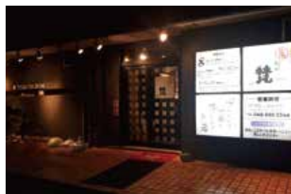
おしゃれな外観が目印

私が今回ご紹介させていただくお店はつくばエクスプレス八潮駅北口より徒歩10分にある「鶏や梵」さんです。創業は18年前、某有名飲食店で修業を積まれたマスターが一念発起して開業した焼き鳥、創作料理屋さんです。今では草加駅東口、群馬県太田市にも店舗を構えています。店内は落ち着いた雰囲気、マスター自ら焼く焼き鳥は地元のお客さんから大人気商品です。料理はもちろんですが、豊富なお酒の種類もあり1度行ったらまた行きたいとなること間違いなしのお店です。カウンターで食事・お酒を堪能するのもよし、テーブル席でゆっくりするのもよし、お座敷で宴会、ファミリーで楽しめるのもよし。八潮へお越しの際には是非お立ち寄りください。