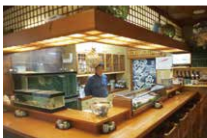
食用かえるを是非ご賞味あれ

また、お酒は、地酒も各種あり日本酒、焼酎、ビール、ソフトドリンクなどお酒も飲めない方もんぴりと色々な料理を楽しめます。