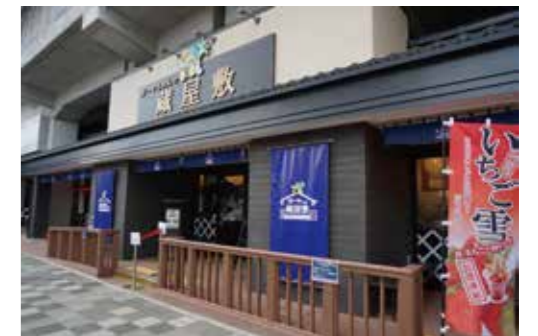
ガーヤちゃんの蔵屋敷