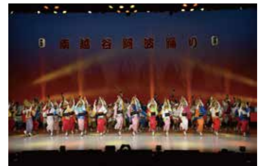
南越谷阿波踊り地元選抜による舞台踊り

本市の人口は現在微増が続いておりますが、将来的には人口減少に転じることが予想されます。将来をしっかり見据え、市民の皆様が、笑顔で、安全・安心、そして、いきいきと暮らせるまちづくりを目指し、「越谷市に住んでよかった、これからも住み続けたい」と思えるまちづくりを引き続き進めてまいります。