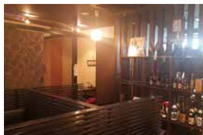
新鮮な信玄どりをを使った炭火焼き鳥は美味

【住所】八潮市八潮1-19-13 ヤヒコマンション1階 【TEL】048-998-5544 【営業時間】17:30～24:00(LO23:30) 【定休日】不定休