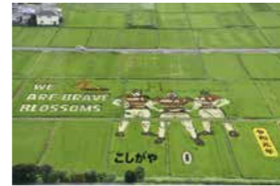
こしがやたんぼアート

近年では、平成20年（2008年）に広大な調節池を中心に都市基盤を整備し、国内最大級のショッピングモールや水辺の都市景観が特徴の越谷レイクタウンが誕生。全国ではじめての、水辺空間と都市生活空間が融合した「親水文化創造都市」としてまちびらきを行い、「平成28年度都市景観大賞（都市空間部門）」で、住宅地等での良好な景観形成、調節池を市民が水辺と触れ合える空間として利用できることなどが評価され、大賞（国土交通大臣賞）を受賞しました。