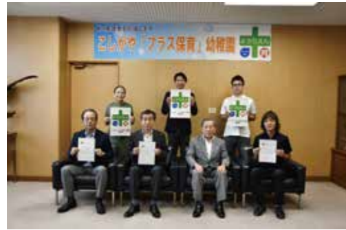
こしがや「プラス保育」幼稚園認定証交付式

少子化・核家族化が進行する中、子育てに対して不安や負担感を持つ保護者が増加傾向にあり、子育て中の保護者の孤立化を防ぐための相談や支援、地域での子育てを支える仕組みが求められています。本市では、地域子育て支援の拠点や病児保育室の設置、こども医療費支給制度の実施等、支援の充実を図っています。