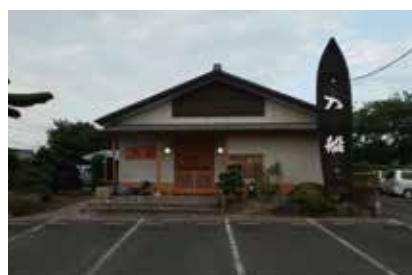
地元住民御用達の名店 / 駐車場も完備

三郷市南蓮沼745の「入船」さんです。通りより一本奥まって営業していますが、知る人ぞ知る絶対間違いの無いお店です。「入船」さんは、1人でも、彼女、仲間と2人でも、宴会でも季節料理をはじめ、魚（海、川）料理、野菜料理、焼き鳥などマスター、女将さんが心を込めてもてなしてくれます。