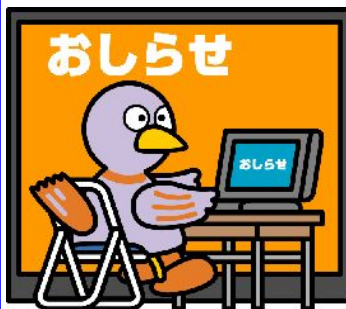
埼玉県のマスコットコバトン

免許権者への更新書類提出期間は免許満了の 90日前 から 30日前 まで(宅建協会経由は100日前から50日前)