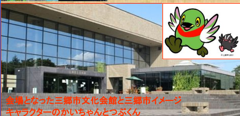
会場となった三郷市文化会館と三郷市イメージキャラクターのかいちゃんつつくん