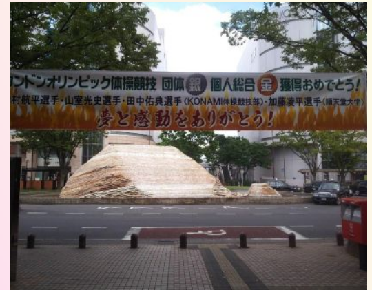
草加駅東口前にて選手の活躍をたたえる横断幕

地域に、また、日本中に感動と勇気を与えてくれた代表選手達。4年後のブラジル大会でも熱戦を繰り広げてくれることを期待します！