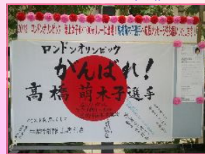
三郷市役所での応援ボード