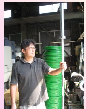
バーベルのシャフトを手にする三代目

これからも、世界のトップレベルの製品で、多くのアスリートをご支援ください。私たちも、応援させていただきます。