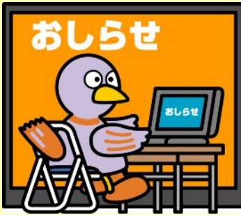
埼玉県のマスコットコバトン

免許権者への更新書類提出期間は免許満了の 90日前 から 30日前 まで(宅建協会経由は100日前から50日前)