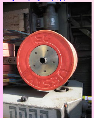
バーベルのプレート部分