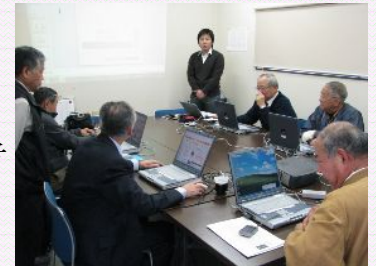
支部主催パソコン研修会

また、ハトマークサイト埼玉のPRの為に東武伊勢崎線新越谷駅構内に電光広告看板を設置いたしました。新越谷駅ご利用の際にはご覧になってくださいませ。