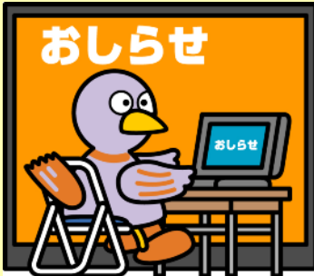
埼玉県のマスコットコバトン

免許権者への更新書類提出期間は免許満了の 90日前 から 30日前 まで(宅建協会経由は100日前から50日前)