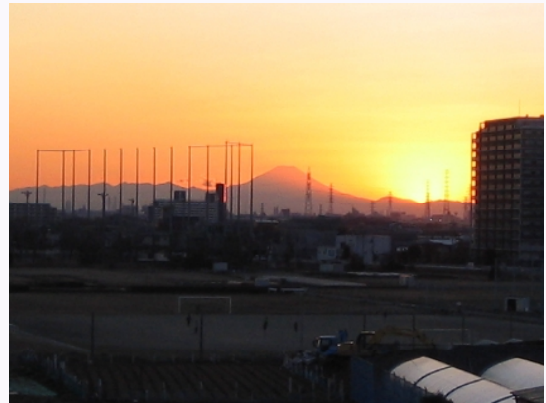
新中川橋から臨む夕焼けの富士山。この日はとっても寒い日だったけど、たくさんの方が足を止めて見ていました。足を止める気持ちわかります。何だか心洗われますね。