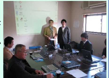
<2月15日実施のパソコン研修会>